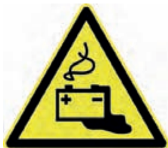
Warnzeichen für eine Batterieanlage

Einzelladeplätze müssen durch geeignete dauerhafte Markierungen gegenüber anderen Betriebsbereichen gekennzeichnet sein, und das Laden von Elektrofahrzeugen darf nur an diesen Ladestellen erfolgen. Die Batterie verbleibt während des Ladevorganges im Fahrzeug.